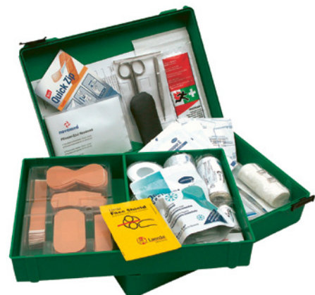
2 Auch im mobilen Arbeitsbereich muss die Notfall-Apothekengriffbereit sein.